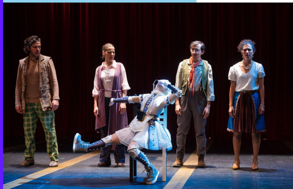
El mar es un pixel Teatro UNAM

FECHA: 28 MARZO HORA: 2:00-5:00 PM LUGAR: CEFE CHAPINERO Valor: $80.000 Cupos: 24